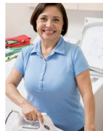
Le secteur des services à la personne croît chaque année. Le Grand Dole souhaite structurer l'offre

Nous n'y échapperons pas : avec un vieillissement de la population de plus en plus caractérisé, les services à la personne vont forcément croître dans les années à venir. Le champ des services à domicile couvre un éventail de métiers encadrés par des professionnels formés et qualifiés depuis les services à la famille jusqu'aux services aux personnes dépendantes, en passant par les