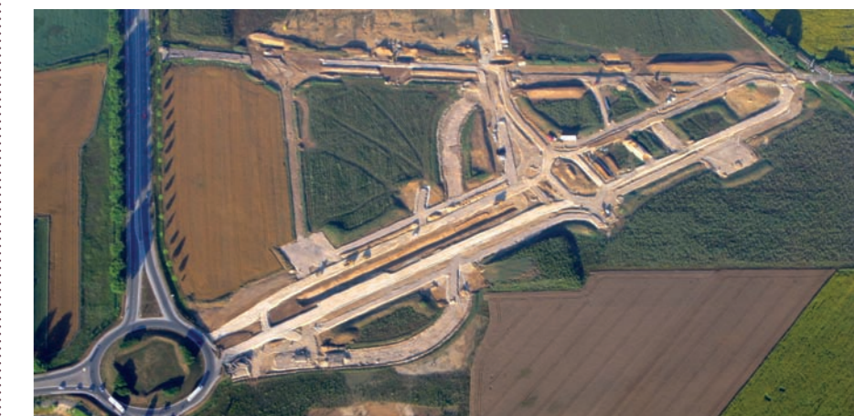
Stanley s'est associé à Gazley Logistics pour acquérir une parcelle de 4,3 ha sur Innovia

Le groupe d'outillage Stanley Black & Decker s'implantera sur le pôle d'activités Innovia en 2011. Le projet prévoit la création d'un bâtiment de 18 000 mètres carrés et générera 40 emplois directs.