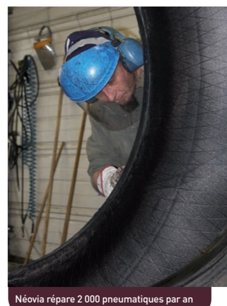
Néovia répare 2 000 pneumatiques par an

n'en oublie pas qu'il est passé par une pépinière d'entreprises pour grandir : "Nous bénéficions de conditions idéales au centre d'activités nouvelles : un atelier de très bonne qualité, un loyer modéré incluant des services comme Internet, pour débiter c'était vraiment bien." Place désormais à une nouvelle aventure, en totale autonomie.