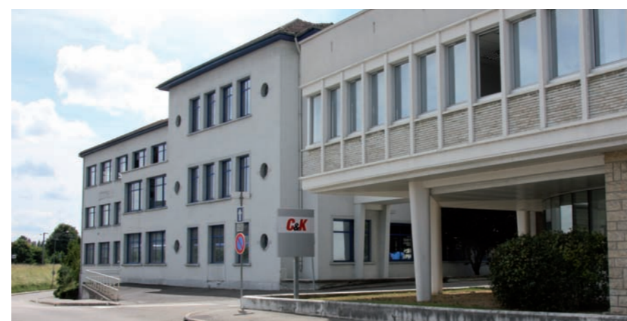
La réhabilitation du site est estimée à 2,8 millions d'euros

A l'initiative du Grand Dole, le bâtiment rue Louis de la Verne va accueillir des activités à vocation économique en 2011